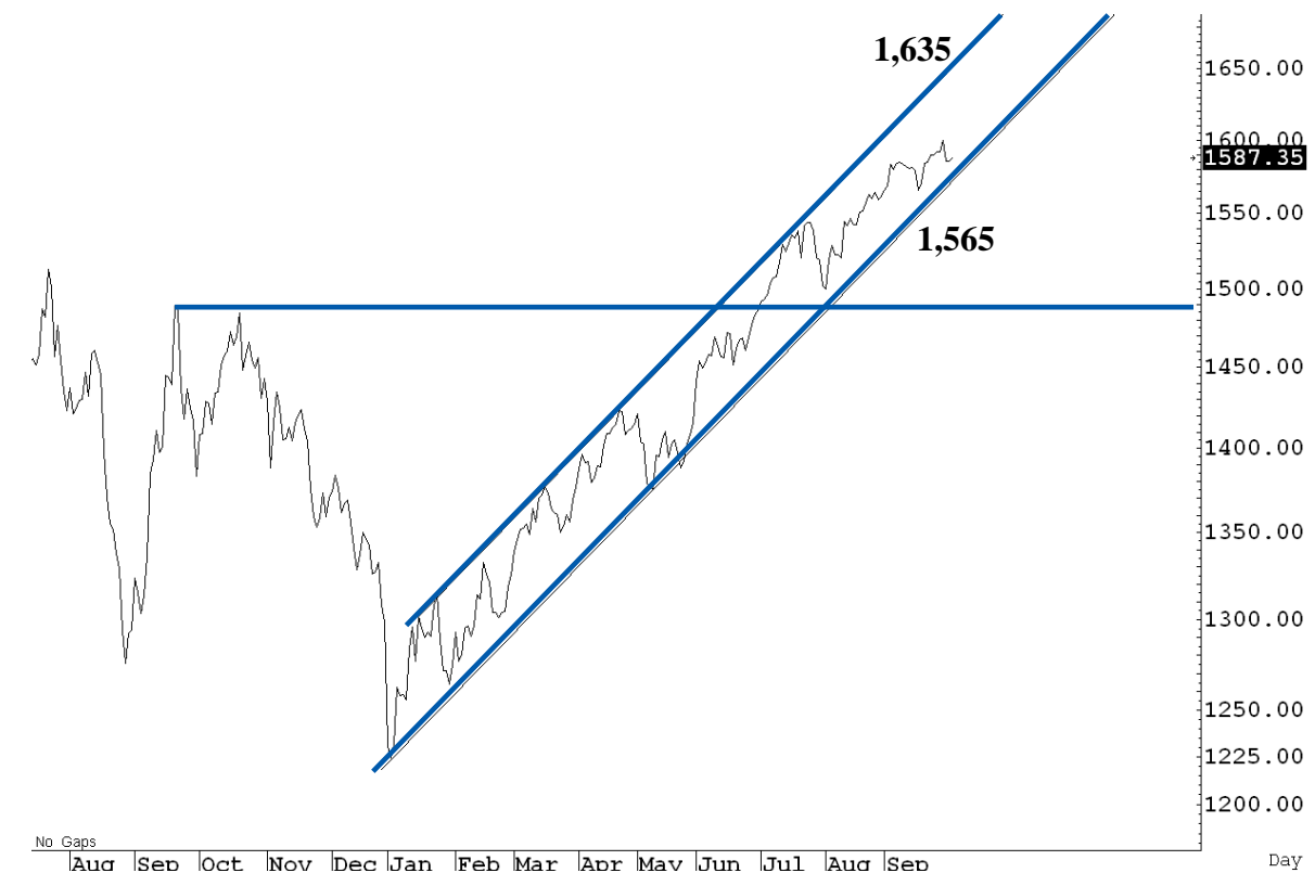
Figure 1 : SET Index daily chart