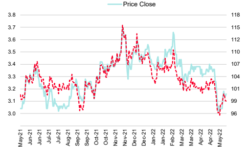
WHA Corp (WHA TB)