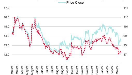
Sino Thai Engineering & Construction Plc (STEC TB)