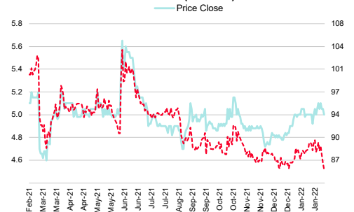
L.P.N Dev (LPN TB)