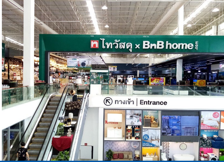
Figure 1: Thai Watsadu x BnB Home’s pilot store on Srisamarn Road in Bangkok – home improvement items on the upper floor