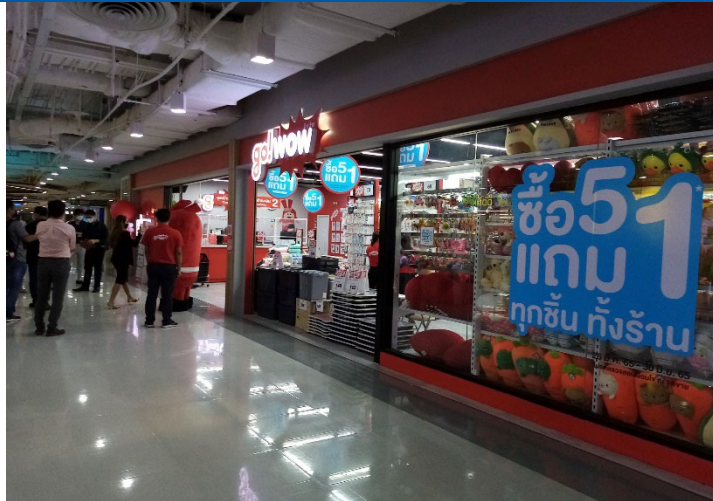
Figure 3: go! Wow store at Seacon Square mall in Bangkok