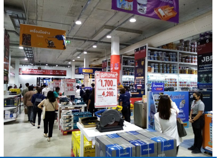
Figure 2: Thai Watsadu x BnB Home’s pilot store – construction materials section is on the lower floor