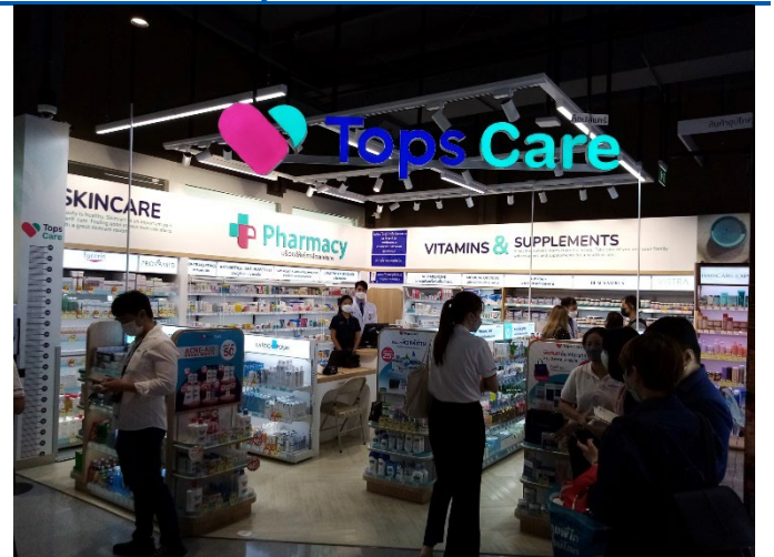
Figure 6: Tops Care pharmacy outlet inside Tops Market Pattanakarn 30 Alley branch