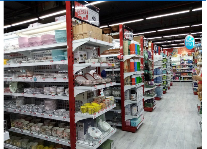
Figure 4: go! WoW store ambience