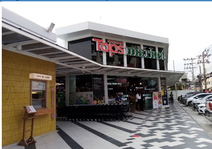
Figure 5: CRC’s first standalone Tops Market store in Bangkok’s Pattanakarn 30 Alley