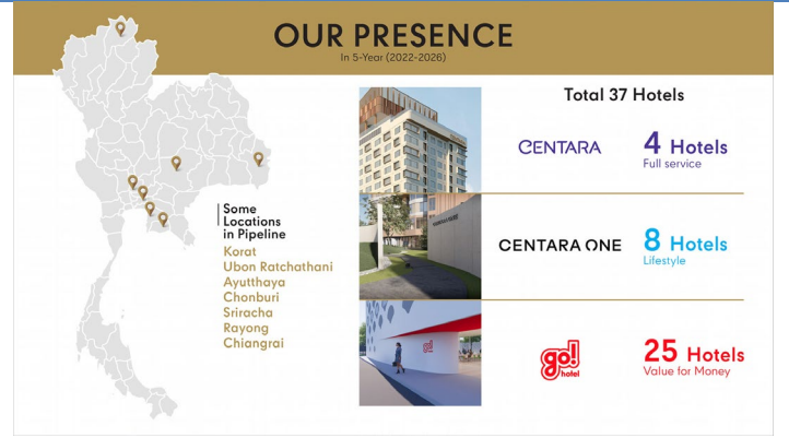
Figure 2: CENTEL's targeted managed hotels for CPN