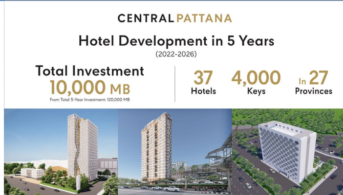
Figure 1: CPN's 5-year hotel development plan