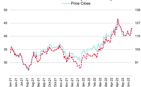
Central Plaza Hotel (CENTEL TB)