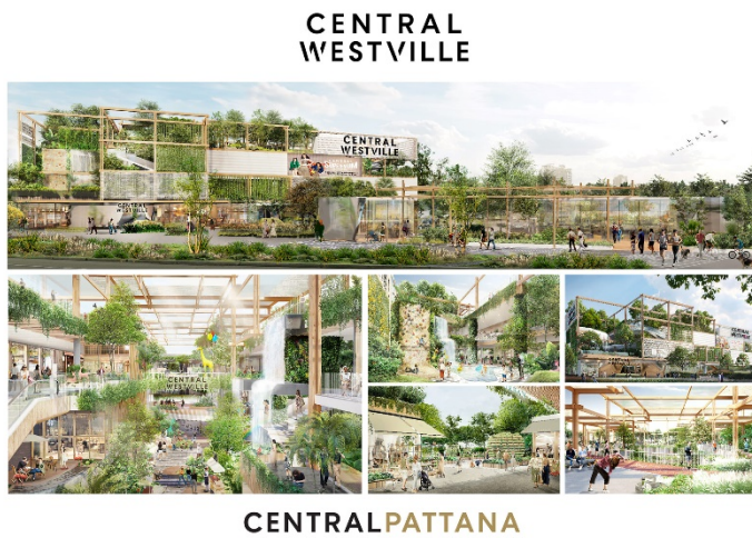
Figure 1: CPN's Central WestVille project