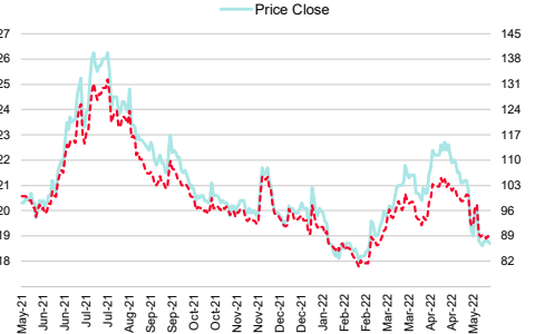
Bangkok Chain Hospital (BCH TB)