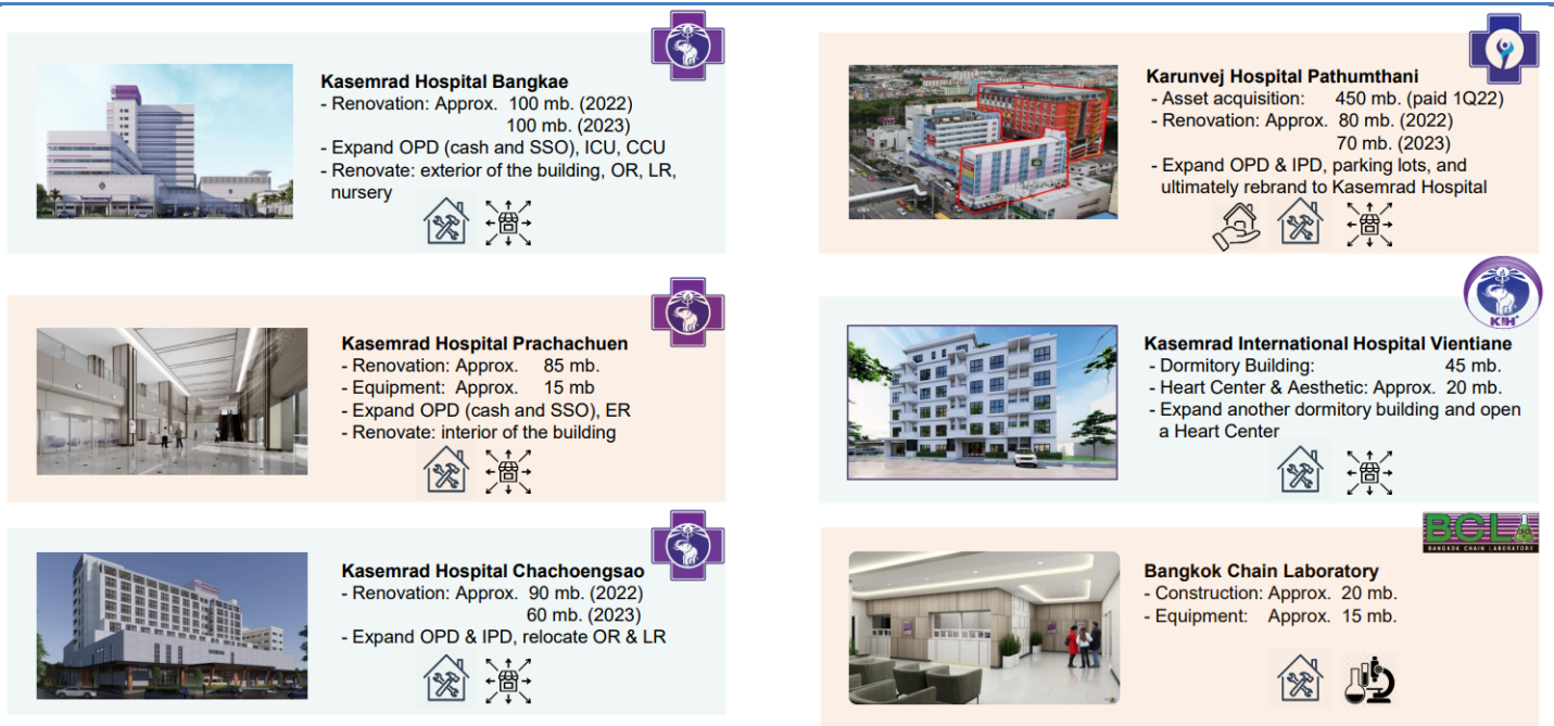
Figure 4: BCH's major investment projects in 2022