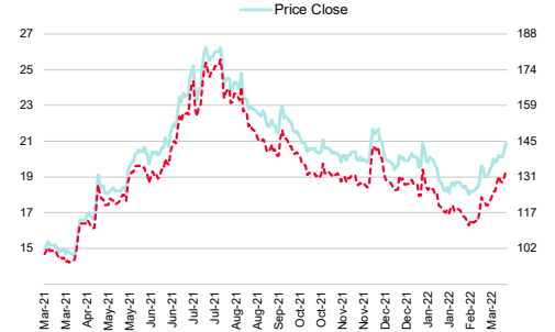
Bangkok Chain Hospital (BCH TB)