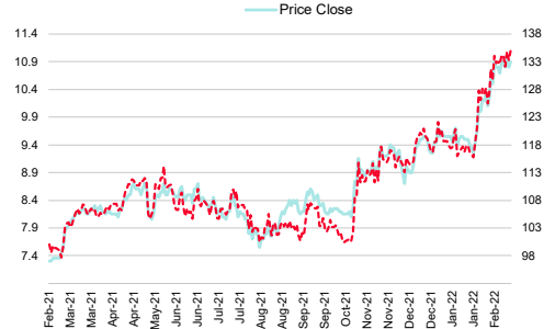
AP Thailand PCL (AP TB)