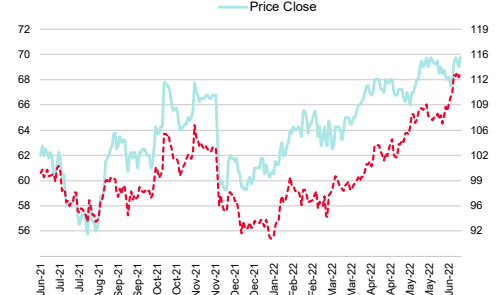
Airport of Thailand PCL (AOT TB)