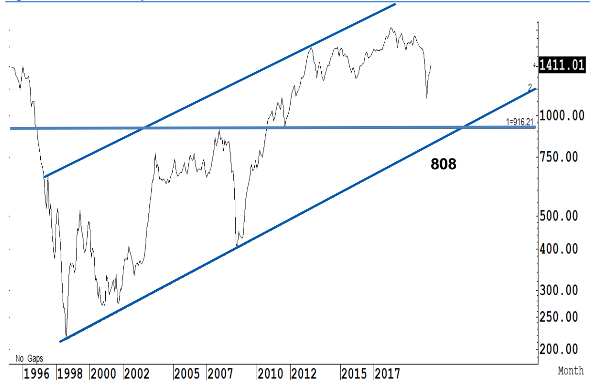
Figure 1 : SET Index daily chart