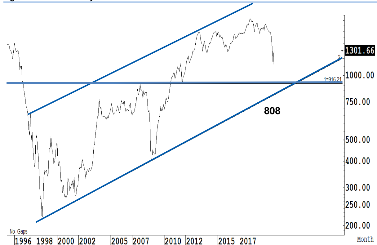
Figure 1 : SET Index daily chart