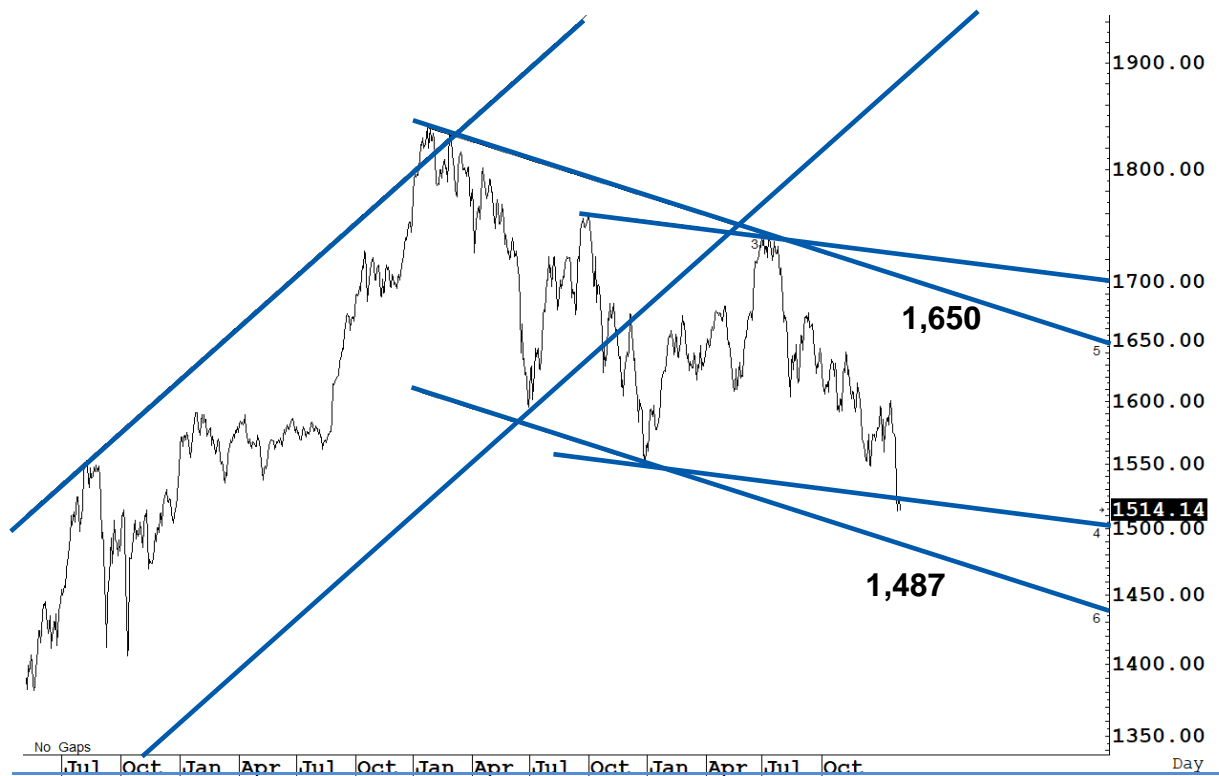
Figure 1 : SET Index daily chart