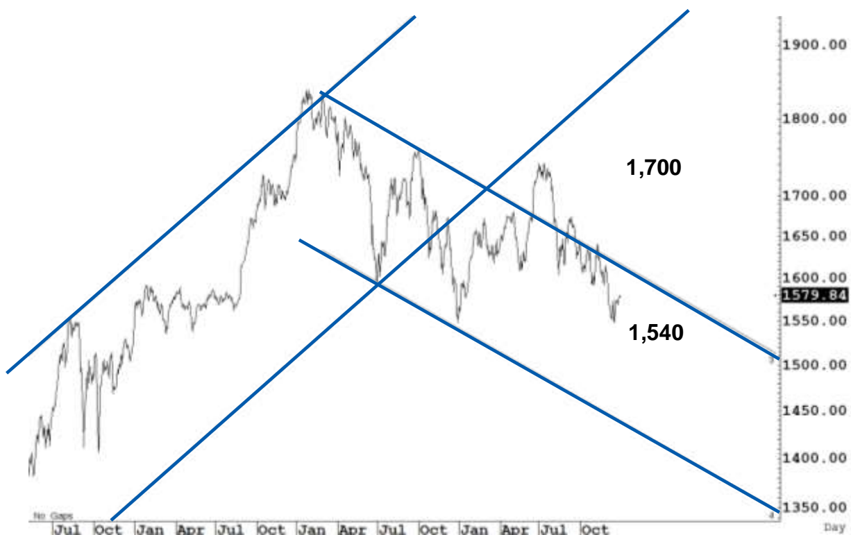
Figure 1 : SET Index daily chart